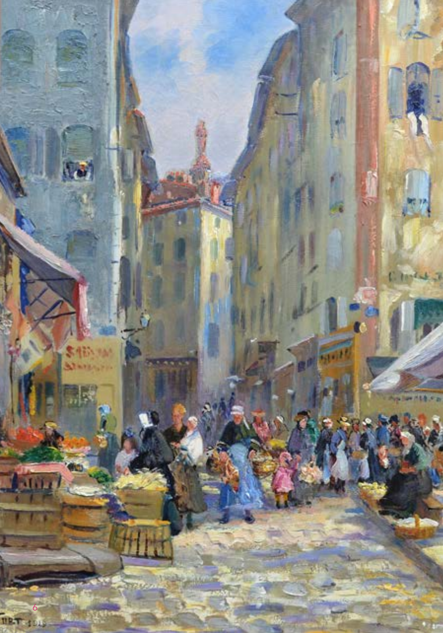
La Place du Plot, P. L. Furt