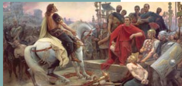
Marché de Vorey