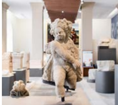
Galerie historique, musée Crozatier