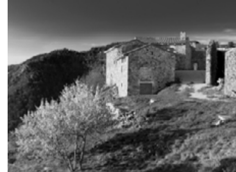
Hameau de Saint-Quentin © Franz Brück