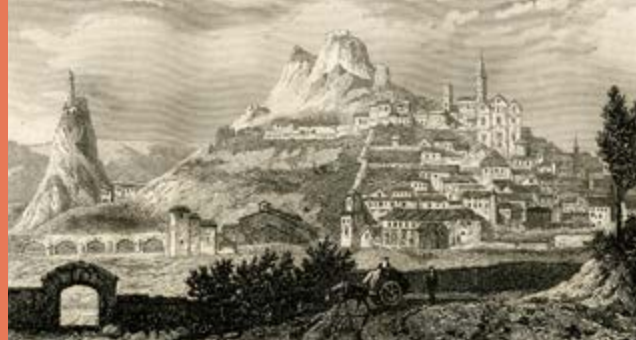
Vue du Puy, Rauch

Création graphique et maquette : → MATRILDE WYDAW → d'après DES SIGNES studio Muchir Desclouds 2018