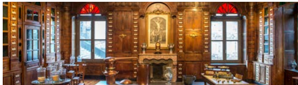
Pharmacie, hôtel-Dieu

// FAMILLE // à partir de 8 ans Jeudis 16/23/30 juillet, 6/20/27 août à 14h30 SUPER HÉROS Cf. p. 20