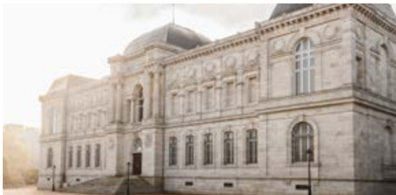
Musée Crozatier côté jardin