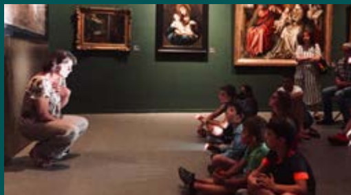
Étrange nuit au musée