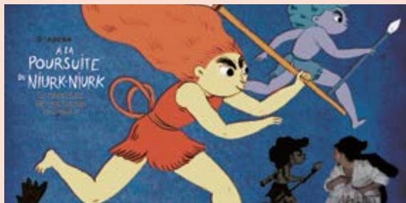
Mus(art)dez au jardin